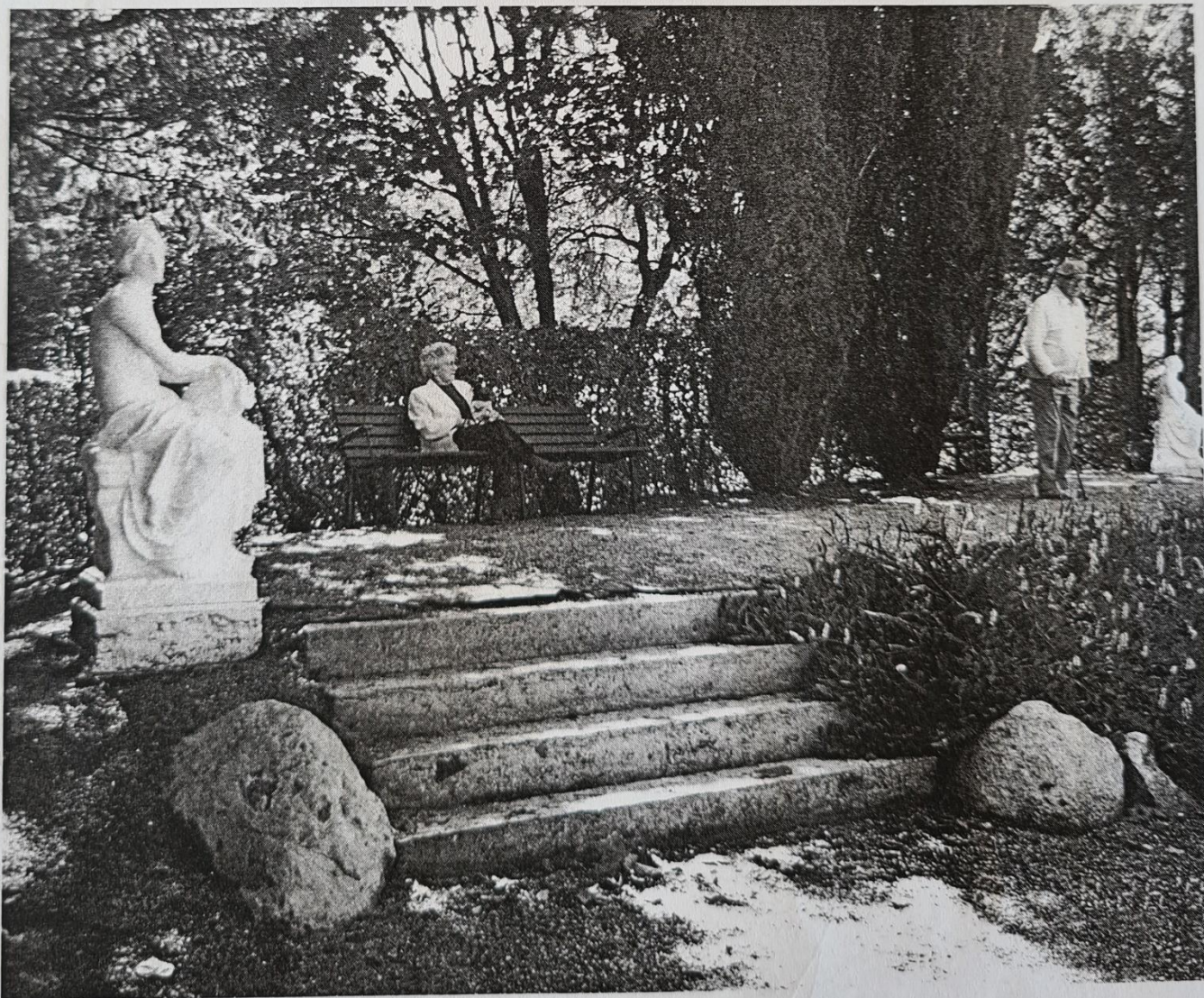
Floras Høj fotograferet 1990.

Det unge par blev vel modtaget i sognet. De kom som et frisk pust; men deres