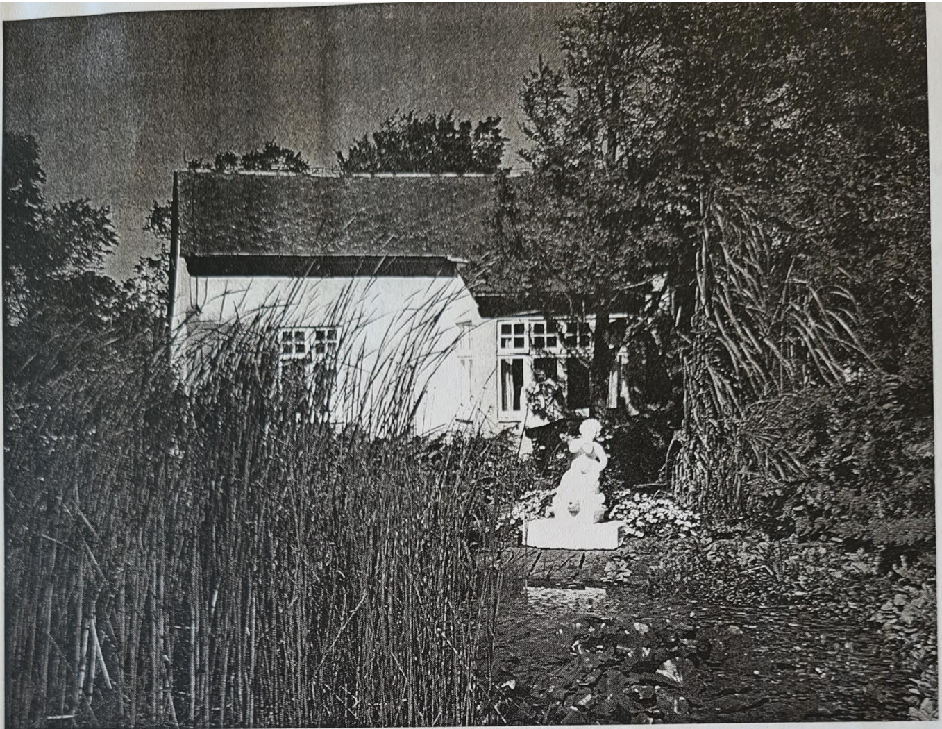
Det lille gule hus »Trosalta« fotograferet 1990.